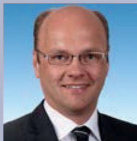
Markus Leßmann Leiter der Abteilung Pflege, Alter, demo- grafische Entwick- lung, Ministerium für Gesundheit, Emanzi- pation, Pflege und Alter des Landes Nordrhein-Westfalen