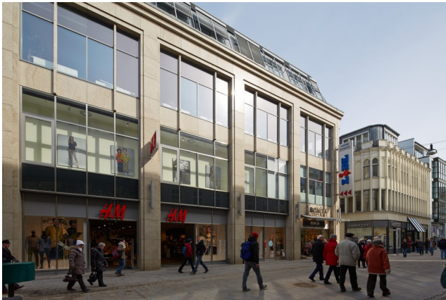
Bestandsimmobilie in Rostock, Kröpeliner Straße 57. Hennes & Mauritz befindet sich unter den besten drei Mietern des Aachener Spar- und Stiftungs-Fonds.