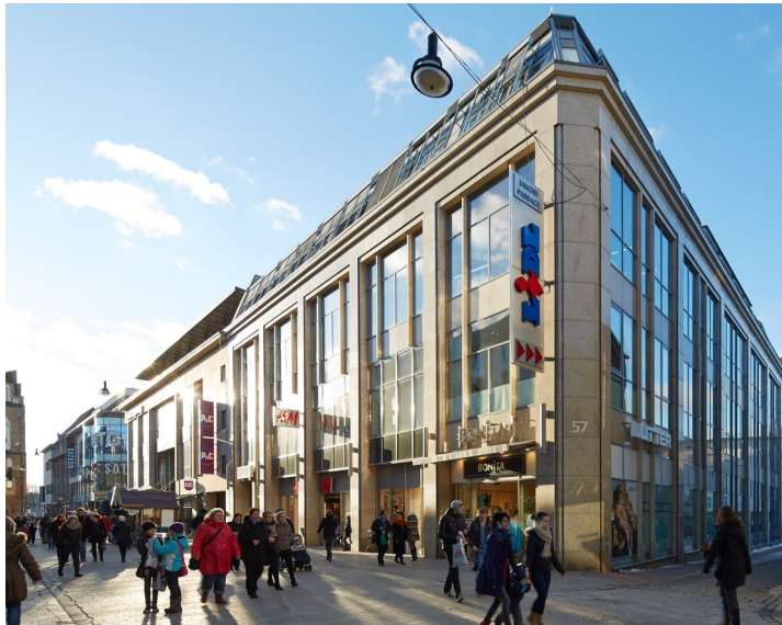
Rostock, Kröpeliner Straße 57 - In den Top-20-Citys sind im Jahr 2014 samstags im Schnitt ein Viertel mehr Menschen unterwegs