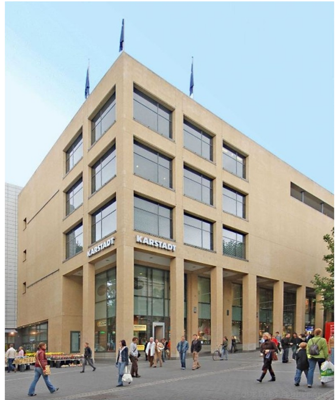
Der Schlüssel zum Erfolg von Kaufhäusern liegt laut HDE in einem fokussierten Sortiment, akzeptierten Eigenmarken und einer attraktiven Vermarktung.