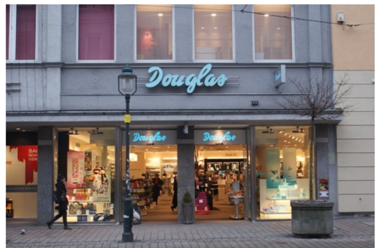
Foto: Mit Douglas haben wir in unserer Liegenschaft Augsburg, Bürgermeister-Fischer-Str. 5; Moritzplatz 7, einen Mieter, der im Einzelhandelsranking 2011 mit dem 4. Platz mit an der Spitze liegt.

Amazon führt mit Abstand die Liste der beliebtesten Händler an. Die Drogeriemarktkette dm und der Lebensmittelhändler Globus belegen die Ränge 2 und 3.