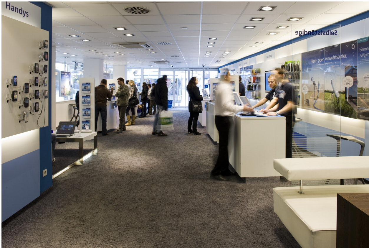
Foto: Mehr Beschäftigte im Einzelhandel.

Gerade die versicherungspflichtigen Beschäftigungen haben im Vergleich zum Vorjahr zugenommen.