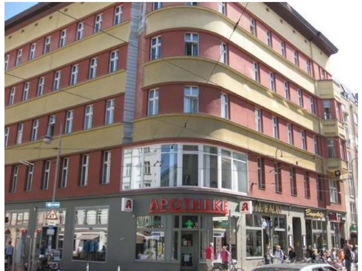
Unser Objekt, die „Rothe Apotheke“, auf der Neuen Schönhauser Straße befindet sich an einer der beliebtesten Shopping-Adressen Deutschlands